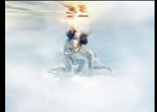
Argazkia: No solo el frio hiela - Montse Giral - Barcelona