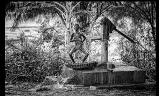
Argazkia: La ducha - Jose Beut - Valencia