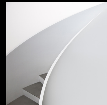
Argazkia: Escalera abstracta - Isabel Ripoll - Villena, Alacant