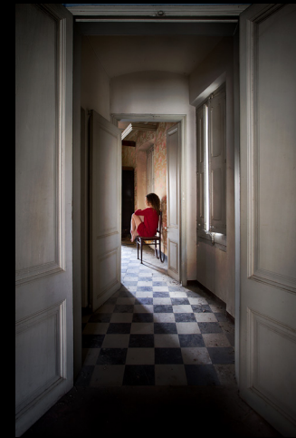
Argazkia: Recuerdos - Miquel Planells - Banyoles, Girona

ortzadarordizia@gmail.com 647 72 69 95 - 656 72 63 27